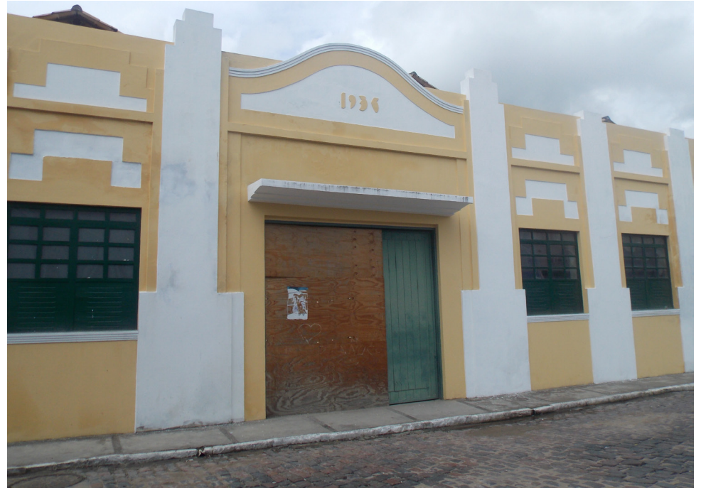
No dia 14 de março de 2013, um carro desgovernado bateu no portão lateral do CAHL. Até o momento, a reforma não contemplou um novo portão.