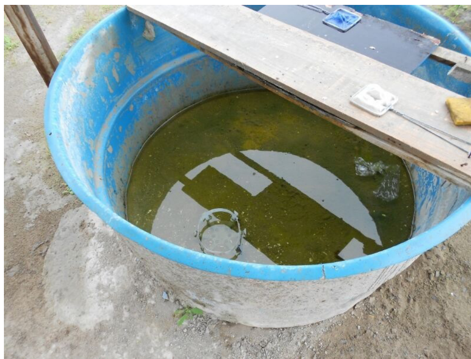
O abandono nas obras também impunha à comunidade acadêmica do CCS a convivência com possíveis focos de doenças