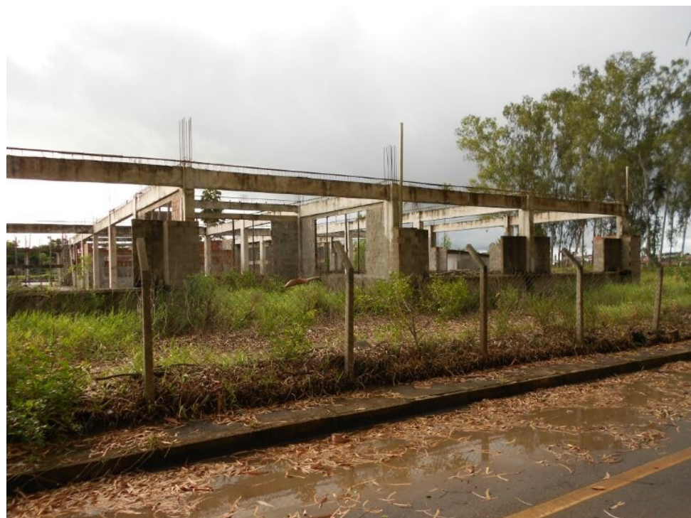
No CCS, as marcas na construção e o mato crescente mostram que há muito se espera pela finalização da obra.

Infelizmente, estes não são os únicos exemplos de como os docentes da UFRB têm sofrido com a ausência de uma estrutura mínima para conseguir desempenhar suas funções. Todavia, a APUR não medirá esforços para continuar pressionando para o atendimento das reivindicações da categoria docente e por uma expansão da UFRB com qualidade.