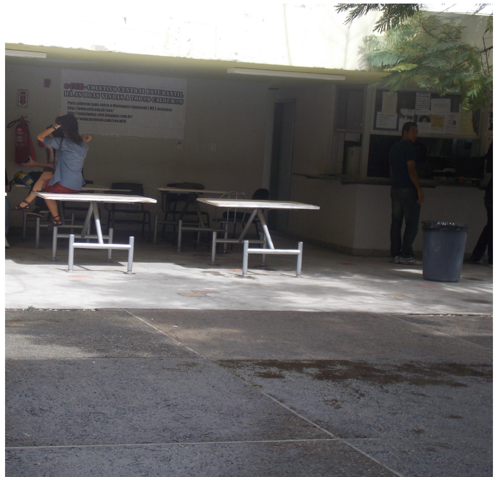
O espaço de convivência do CAHL não tem estado nada convidativo, as cadeiras que compunham as mesas não existem mais, necessitando de reposição.