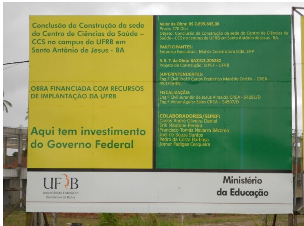
Cansados de esperar pelo término das obras, alguns docentes do CCS não confiam no prazo estipulado na placa.