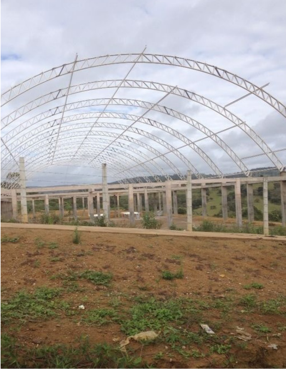
2012 se passou, e este é o estado do Complexo Poliesportivo do CFP.

Ainda em março deste ano, a Superintendência de Implantação e Planejamento do Espaço Físico (SIPEF) lançou uma nota de esclarecimento à Comunidade Amargosense tonando públicas ações para recuperar a infraestrutura física do prédio onde deveria funcionar o Centro de Artes de Amargosa: Diversidade, Universidade, Cultura e Ancestralidade – a CASA DO DUCA. Todavia, até o momento, o prédio continua sem nenhuma obra em execução.