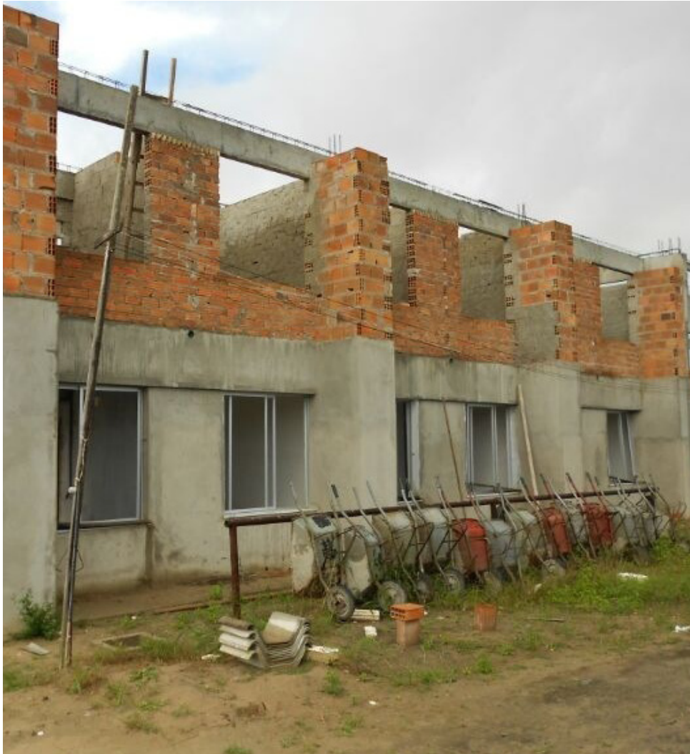
Normalmente, esta é a imagem das obras no CCS, equipamentos parados e nenhum trabalhador.

Desde a greve docente de 2012, a Associação dos Professores Universitários do Recôncavo (APUR) tem reivindicado por uma estrutura mínima para o funcionamento dos cursos oferecidos na Universidade Federal do Recôncavo da Bahia (UFRB). De lá para cá, pouca coisa mudou. Todos os campi da UFRB, em diferentes graus e setores, continuam esperando início e/ou conclusão de obras essenciais de funcionamento.