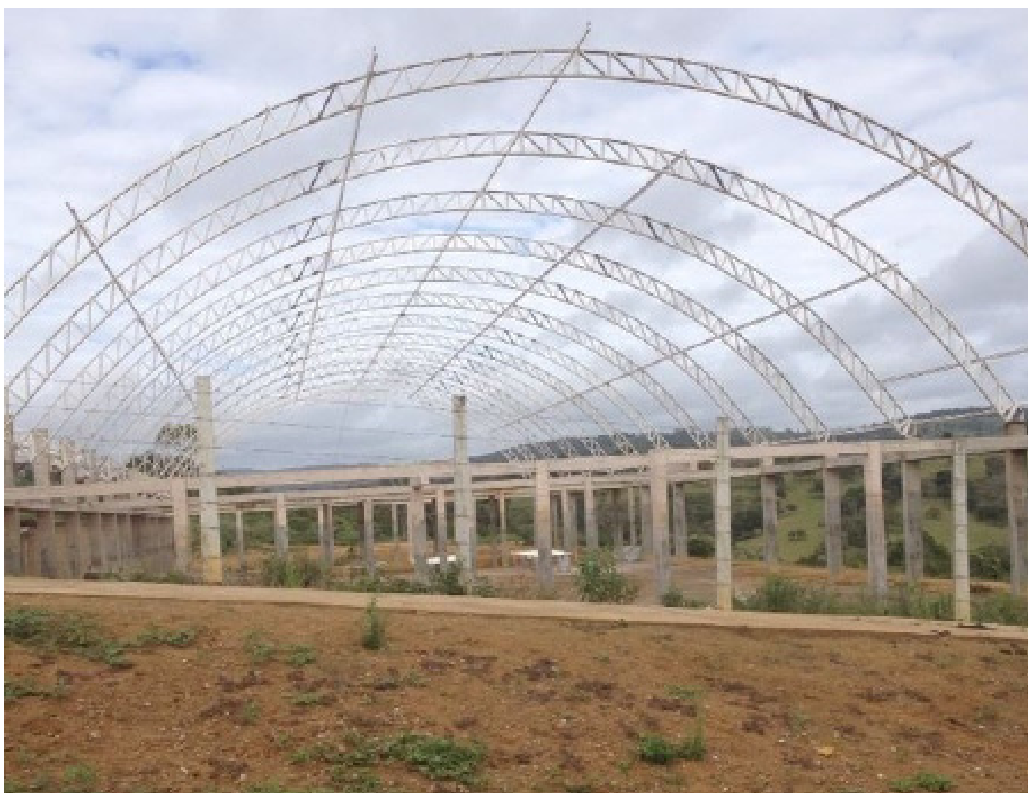
2012 se passou, e este é o estado do Complexo Poliesportivo do CFP.