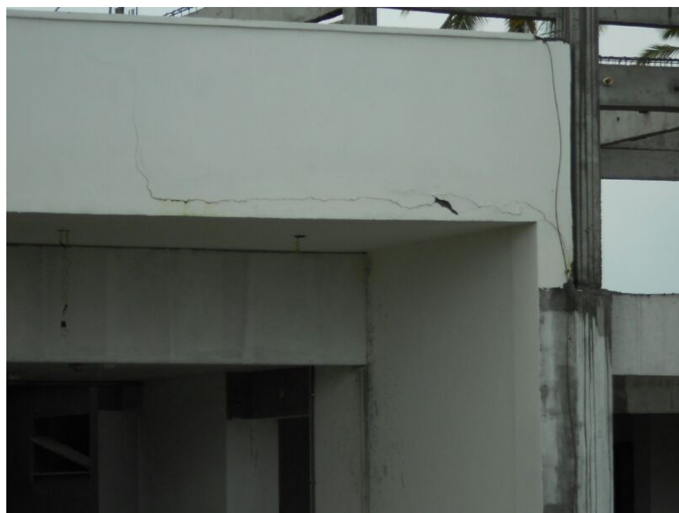
Rachaduras são visíveis em diversos pontos do CCS.