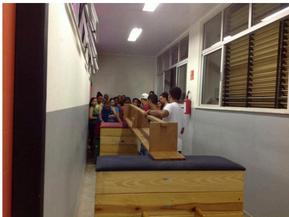
Para não prejudicar o aprendizado dos estudantes, os professores improvisam aulas até nos corredores no CFP.