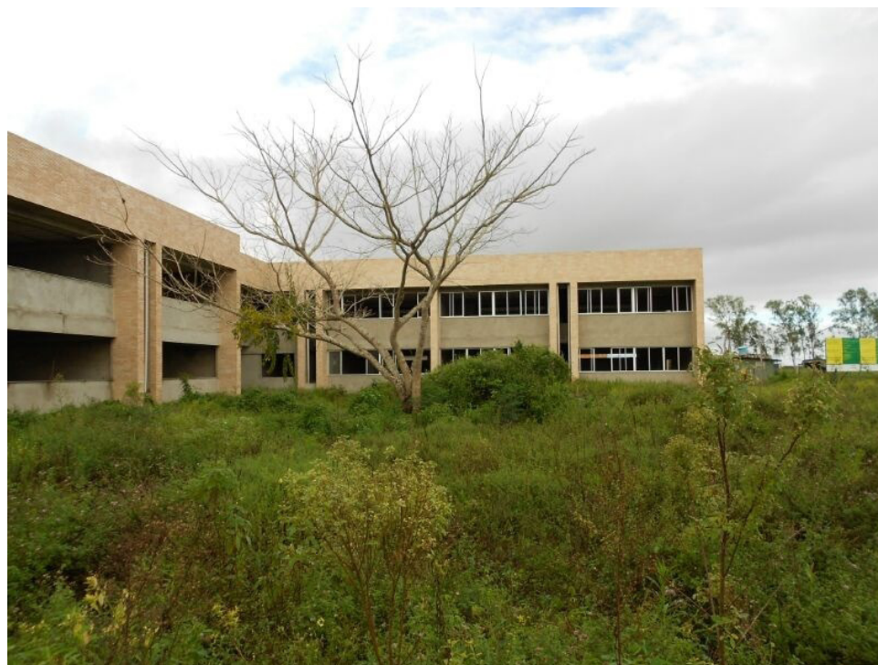
Mesmo em obras mais adiantadas, o CCS convive com o abandono.