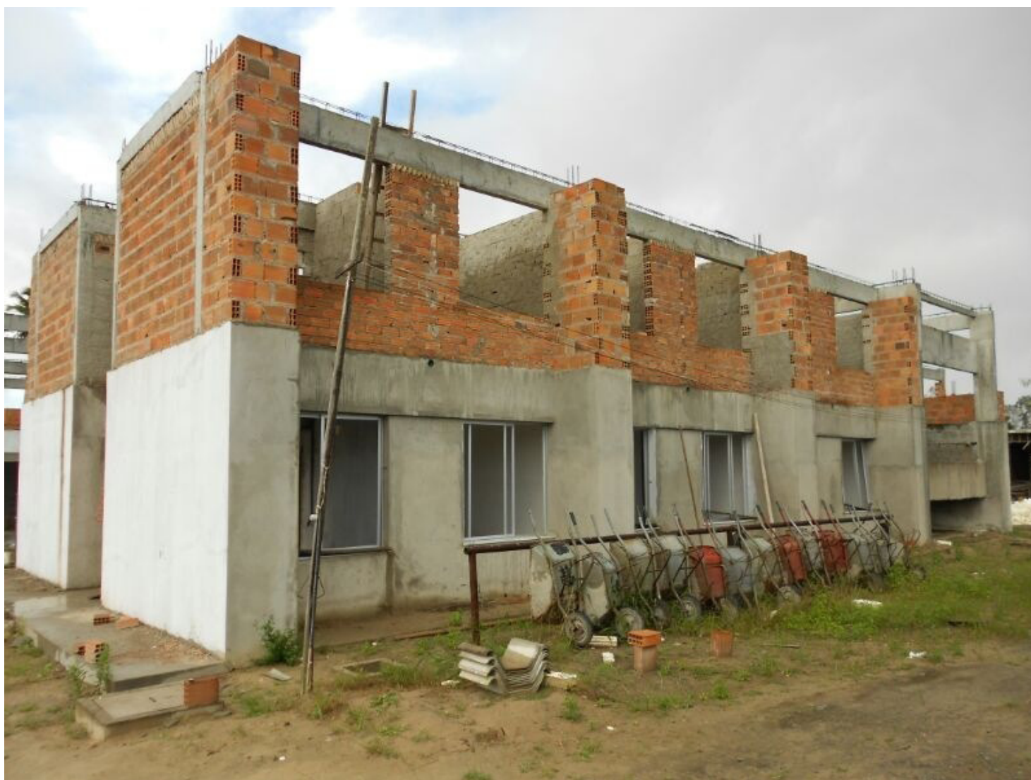
Normalmente, esta é a imagem das obras no CCS, equipamentos parados e nenhum trabalhador.