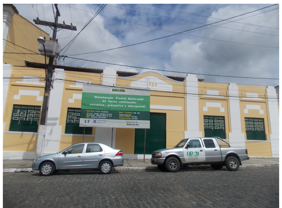
Mesmo com a fachada recém pintada, o CAHL é um dos centros que mais sofre com problemas estruturais.